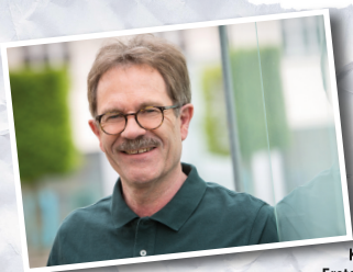
Konrad Seigfried Erster Bürgermeister

Fairtrade – weil wir in Ludwigsburg ein Vorbild für soziale Gerechtigkeit und fairen Handel sein wollen.